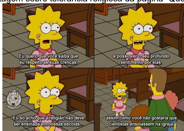
Figura 1: Postagem sobre tolerância religiosa da página “Quebrando o Tabu”